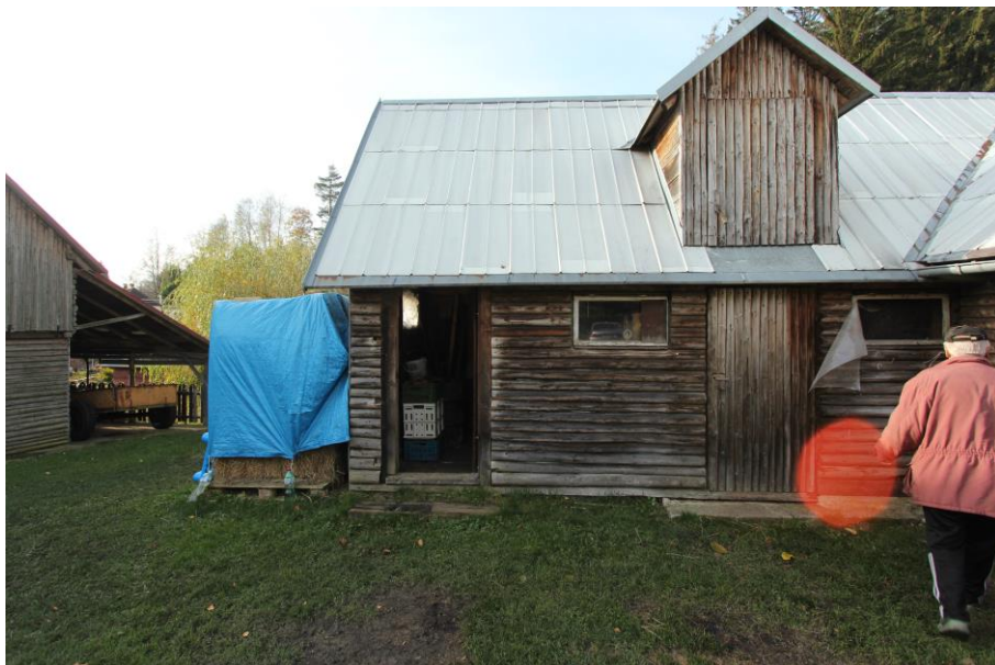
"Kamenice v Kytlicích u č.p. 59"