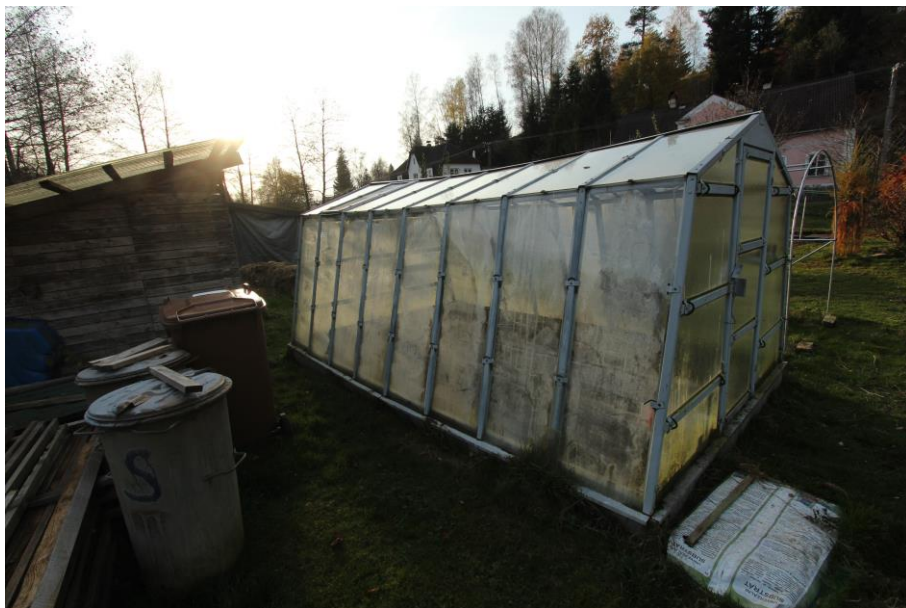
"Kamenice v Kytlicích u č.p. 59"